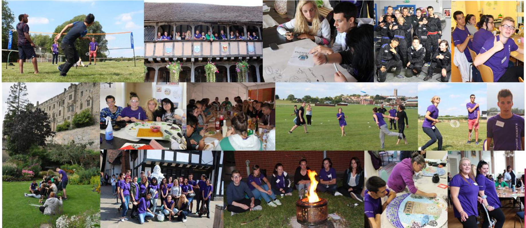
Photos from Eurocamp 2015 in Warwick