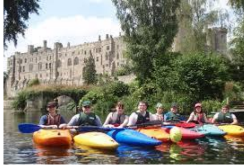
ST NICHOLAS PARK, WARWICK